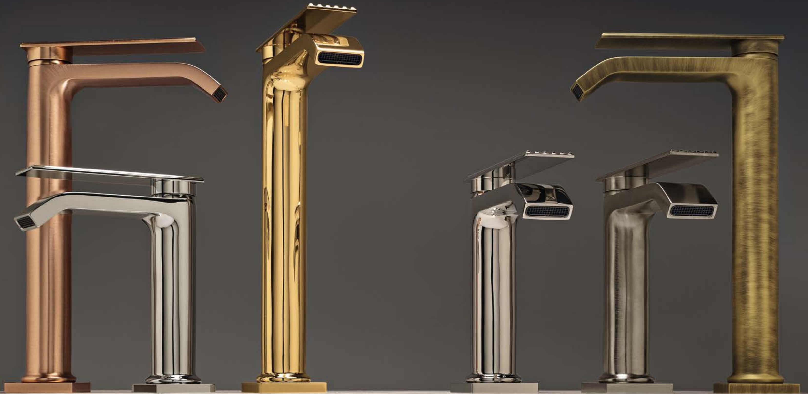
SZ brushed rose gold